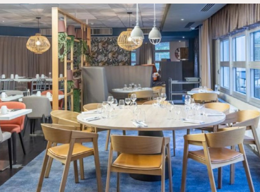
ARÔME RESTAURANT - BAR À VINS